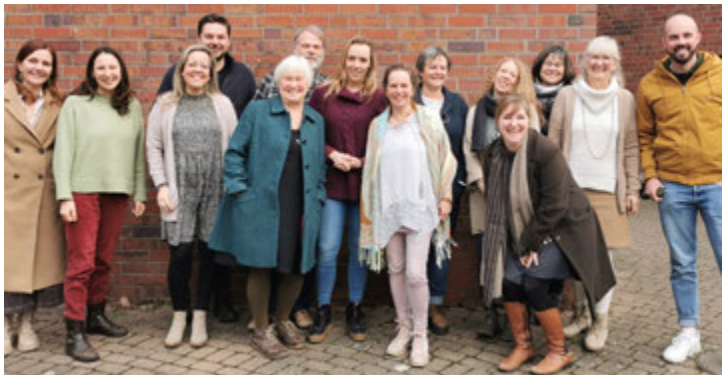
Unser Wald- und Garten-Team