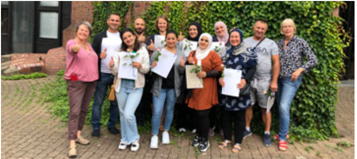
Stolze TeilnehmerInnen mit ihren Zertifikaten

Unsere Kurse starten fortlaufend. Bitte fragen Sie bei uns nach: Sprachbüro, Telefon: 02421/188-116 oder 188-216.